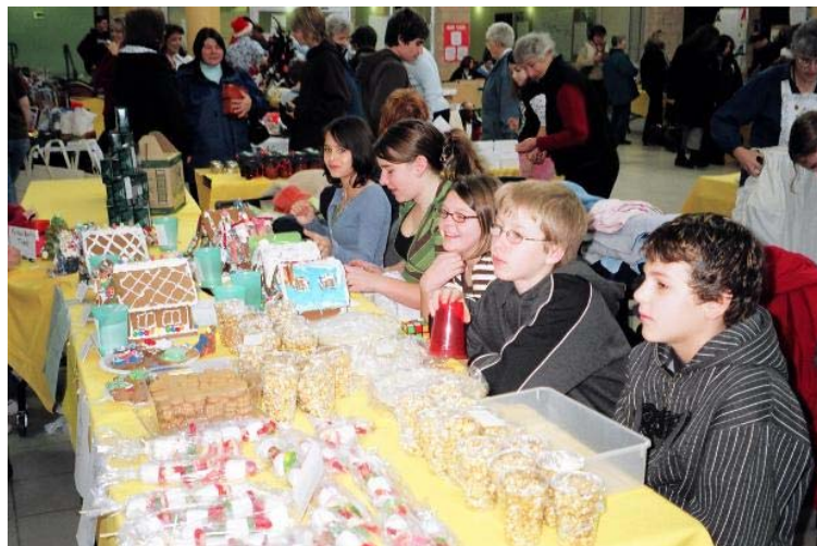
Grupa młodzieży na Bożonarodzeniowym Glitter Bazaar