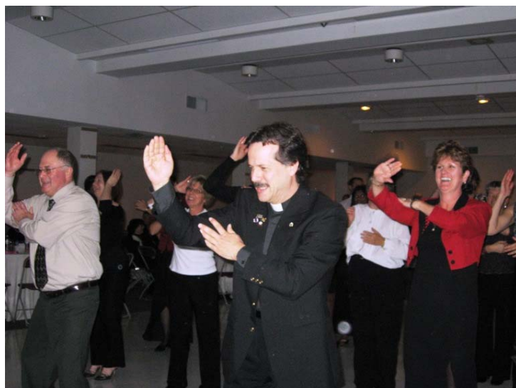
Gala w Mississauga, St. Christopher's Church Hall

Proszę odwiedzić stronę internetową parafii po więcej zdjęć, modlitw, wiadomości z Watykanu i wiele więcej!